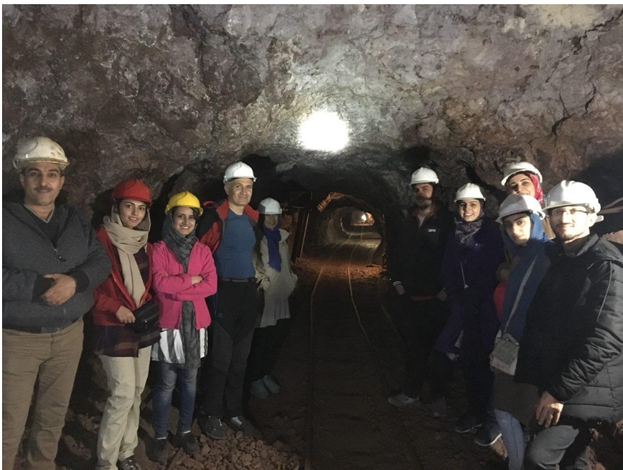
بازدید از معدن فیروزه نیشابور