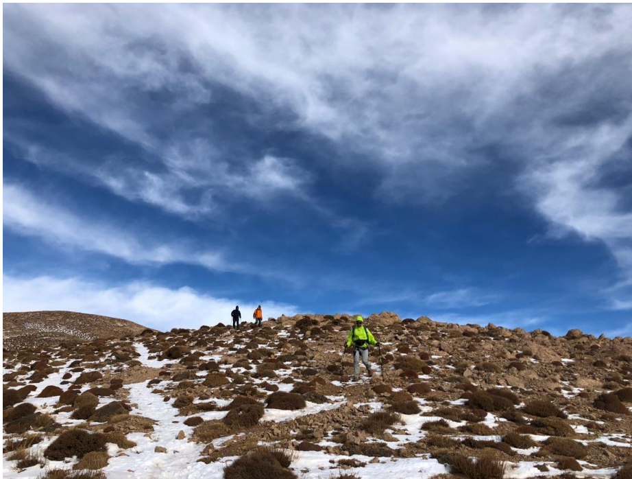
در مسیر بازگشت از قله