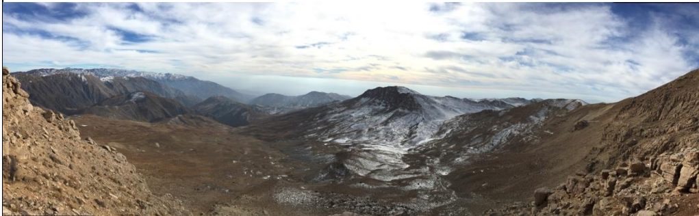
در مسیر پناهگاه