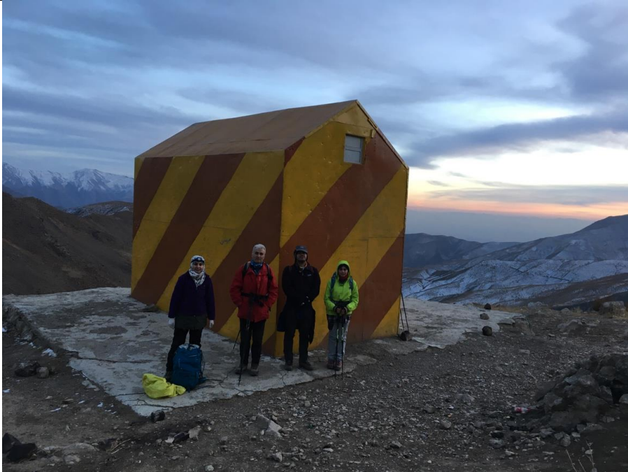
پناهگاه دو شهید