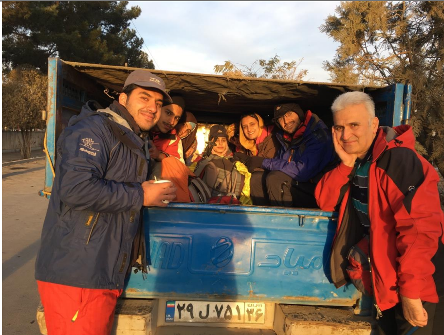
نیشابور، پیش از شروع برنامه