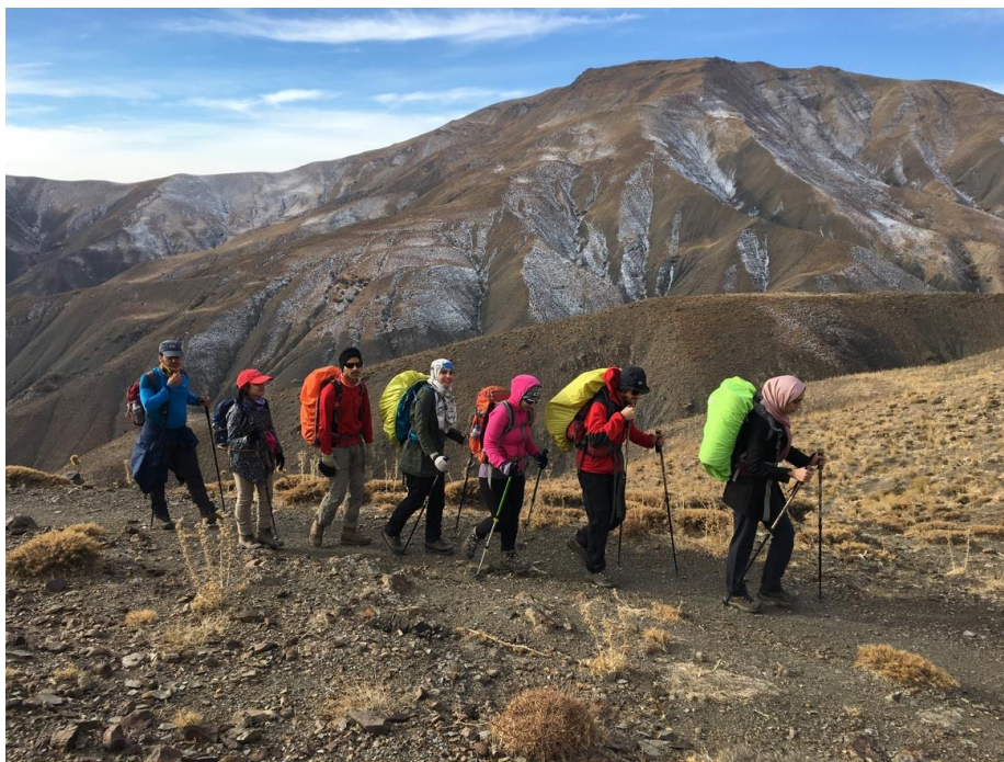
در مسیر پناهگاه